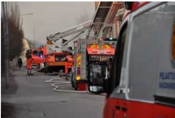
Pelastuslaitos on monella autolla paikalla