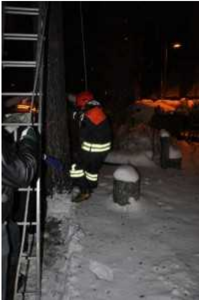
Kissa pääsi alas sylissä, palomies köyden varassa