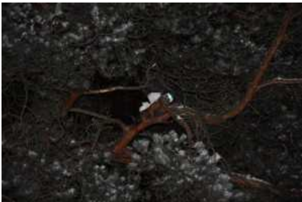
Kissi miukui männyssä surkeana

Tapanilan VPK pelasti jo toista yötä viettämään valmistautuneen kissan puusta tapaninpäivänä. Kaksimiehininen ja yksinainen partio suoriutui työstä reilussa vartissa ja kissa pääsi jälleen ruoka-astioiden ääreen. Ko. kissa on jo VPK:n vanha tuttu muista puista, tällä kertaa pakopaikka oli männyssä n. 9 metrin korkeudessa Kuulijantien ja Kuoppatien kulmilla.