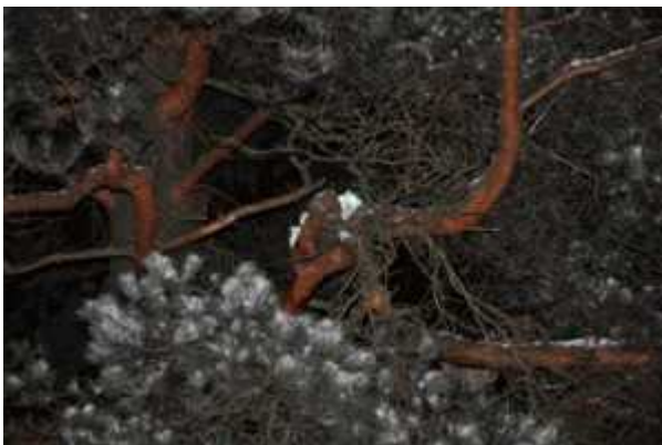
Maukumisen lisäksi kissa viestitti olostaan laserkatseellaan