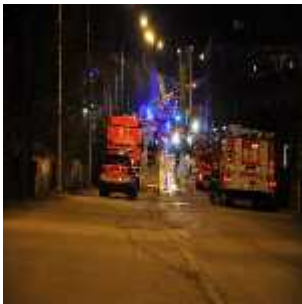
Sammutustyöt jatkuivat myöhään iltaan. Tapanilan VPK (auto oikealla) odottaa jälkisammutustöitä.