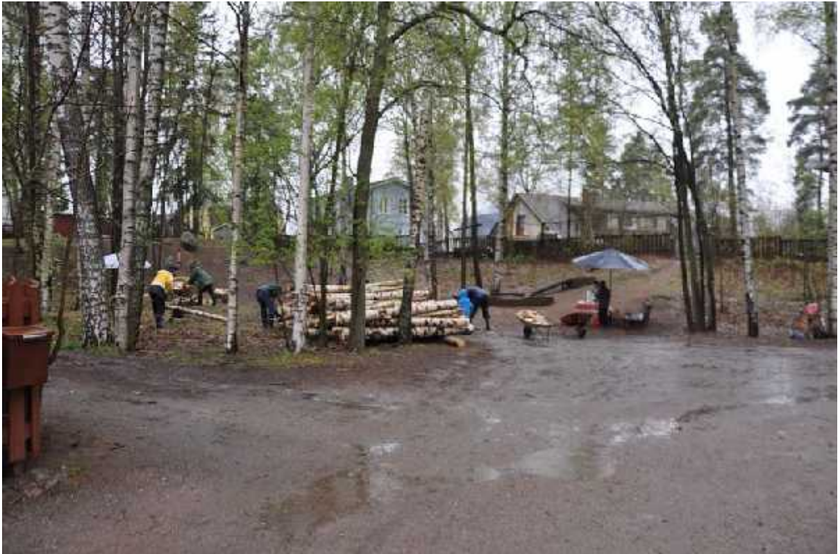
Metsätyömiehet koolla Kalle Pääatalon hengessä