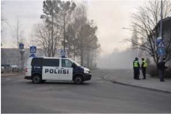
Viertolantie on savuinen ja suljettu