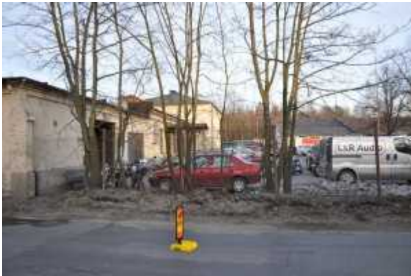
Hallista on tuotu taas ulos paljon harrasteautoja ja -moottoripyöriä