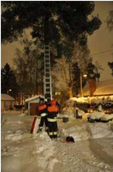
Alimmat oksat olivat n. 9 metrin korkeudella