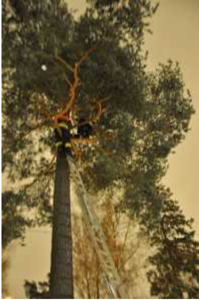
VPK:n Korhonen ja palomies Tuomas saivat lopulta kissan kiinni