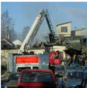
Edellinen tulipalo oli pienempi kuin tämänpäiväinen. Kuva lokakuulta 2001.