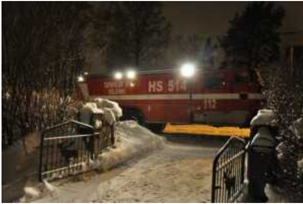
VPK saapui paikalle pisimmällä autollaan