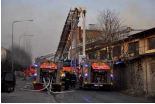
Tikasauto oli välttämätön palon sammuttamisessa